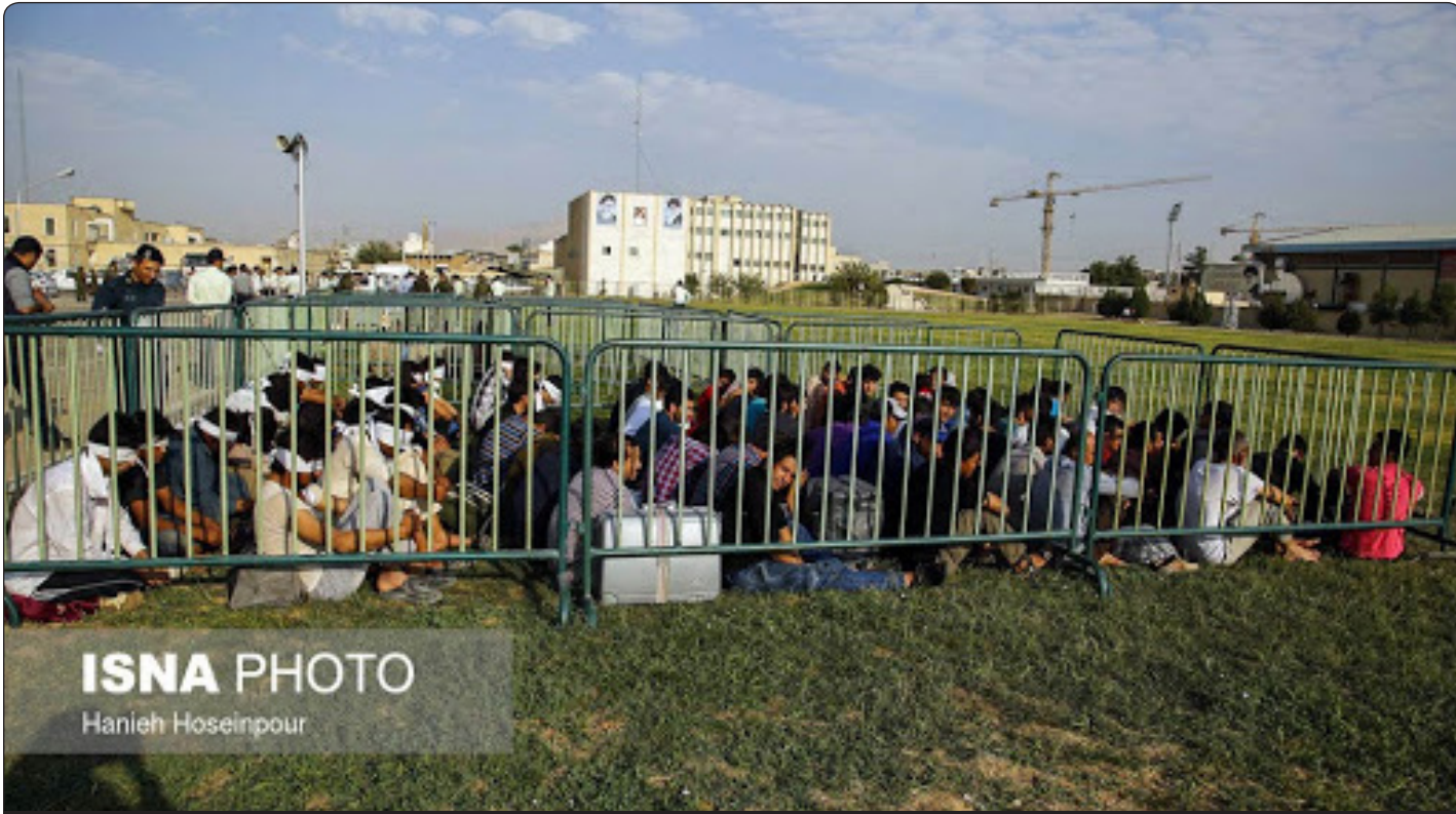
ISNA PHOTO Hanieh Hoseinpour